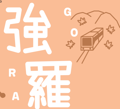
精彩景點 強羅公園